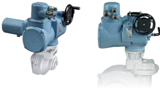
Atuadores CK com redutores Rotork

Base para acionamento de haste ascendente fica separada da caixa de engrenagem, permitindo uma fácil instalação. Em caso de remoção do atuador, a base pode permanecer na válvula para manter a posição. Todas as dimensões e acoplamentos de base cumprem as normas de fixação ISO 5210 ou MSS SP 102.